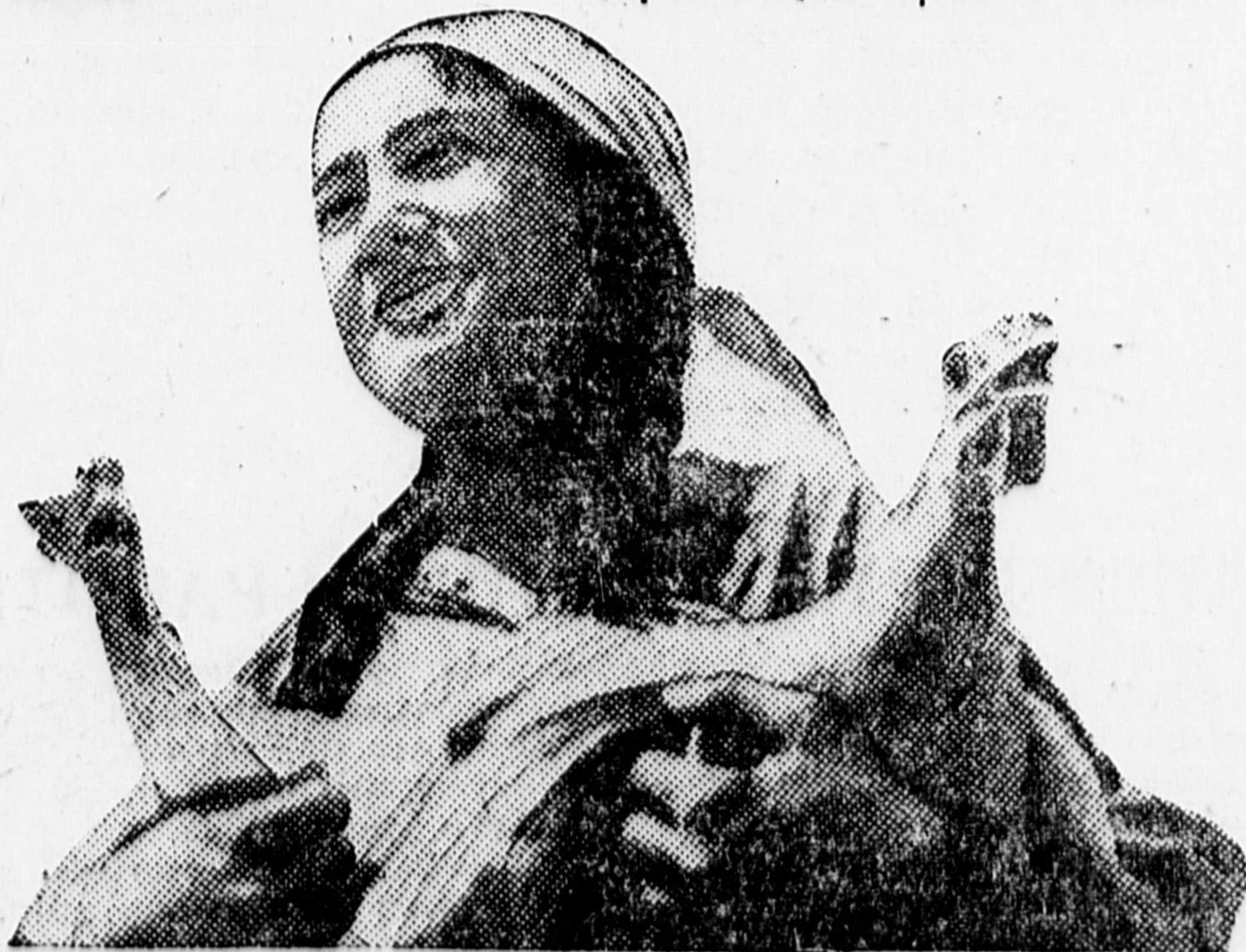
НА СНИМКЕ: узбечка-ударница колхоза «Махнат» (Старая Бухара, Узбекистан).

шурника жалоба! Право на голос завоевав, Входите сюда! Добро пожаловать, Колхозных пашен хозяева!