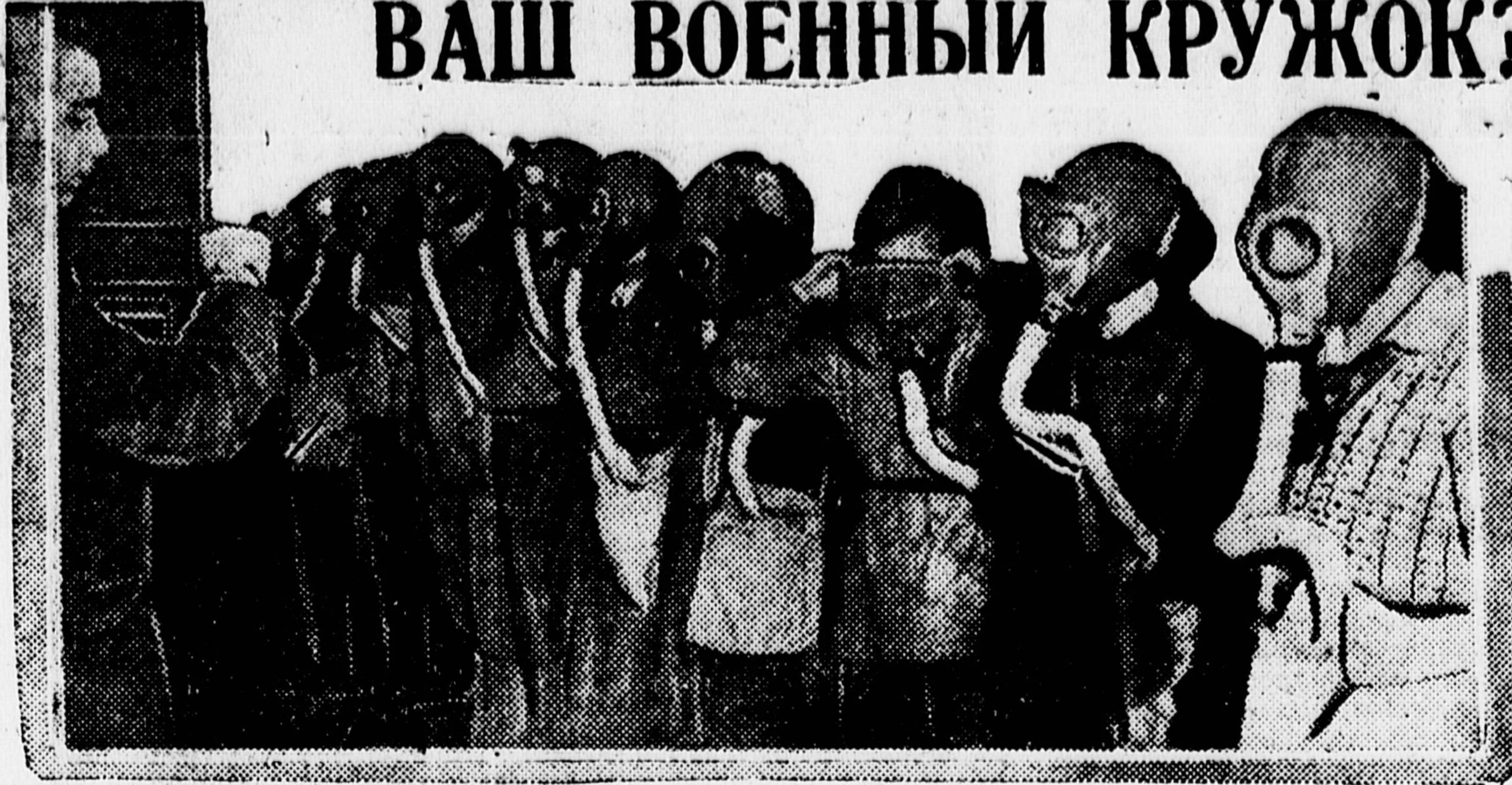
Военные занятия в 29-й школе Бауманского района. Тренировка на быстрое одевание противгазов.

Близится 15-я годовщина Красной армии. Во многих школах и отрядах оживилась военная работа. Тысячи пионеров и школьников охвачены стрелковыми кружками и кружками военных знаний. Кое-где появляются и военно-технические кружки, дающие ребятам возможность освоить военную технику.