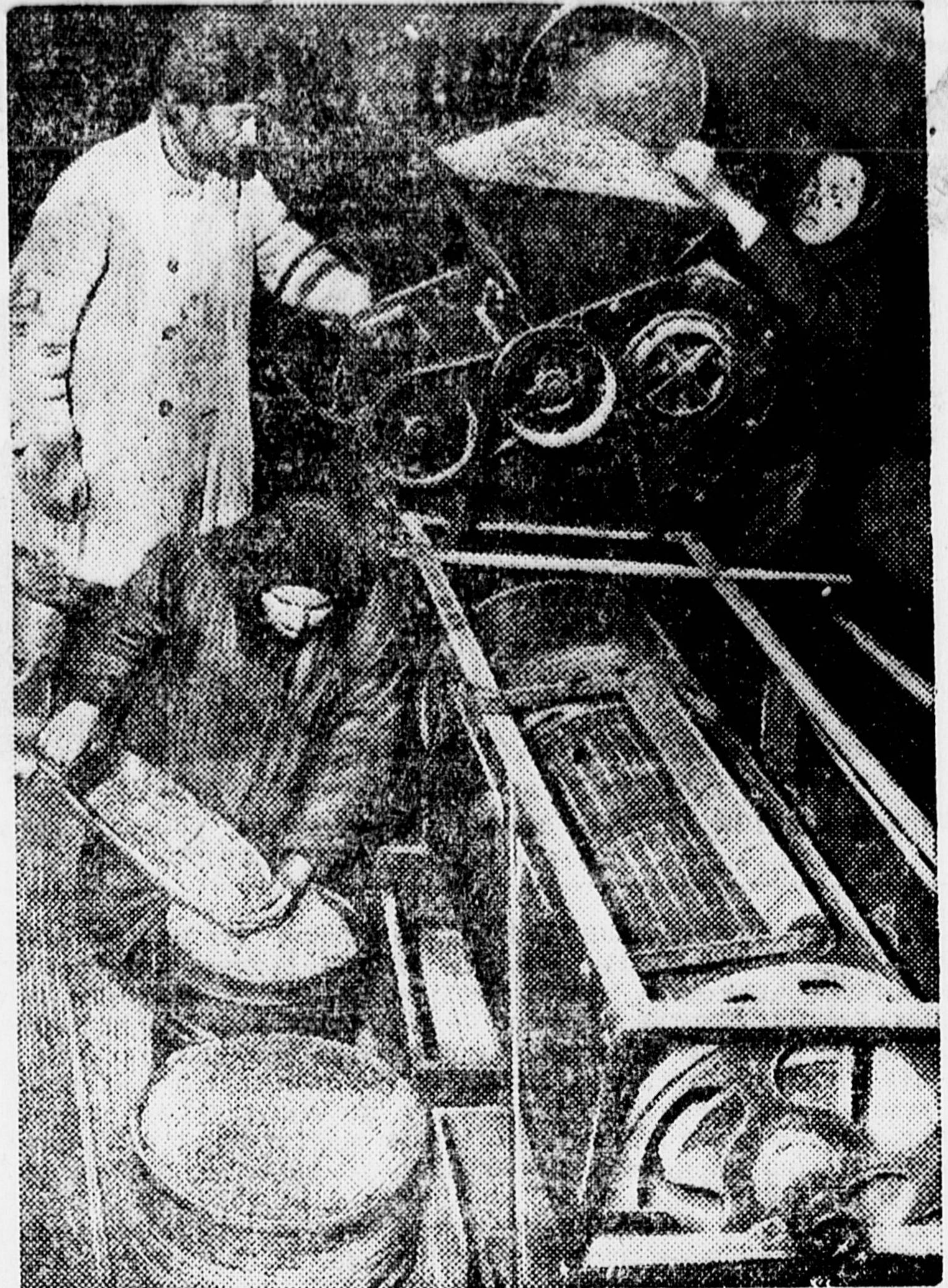
ПОЛНОСТЬЮ ОБЕСПЕЧИТЬ ПОЛЯ СЕМЕНАМИ. На снимке: колхозники сортируют семена к севу.

С'езду ударников-колхозников пионерский салют!