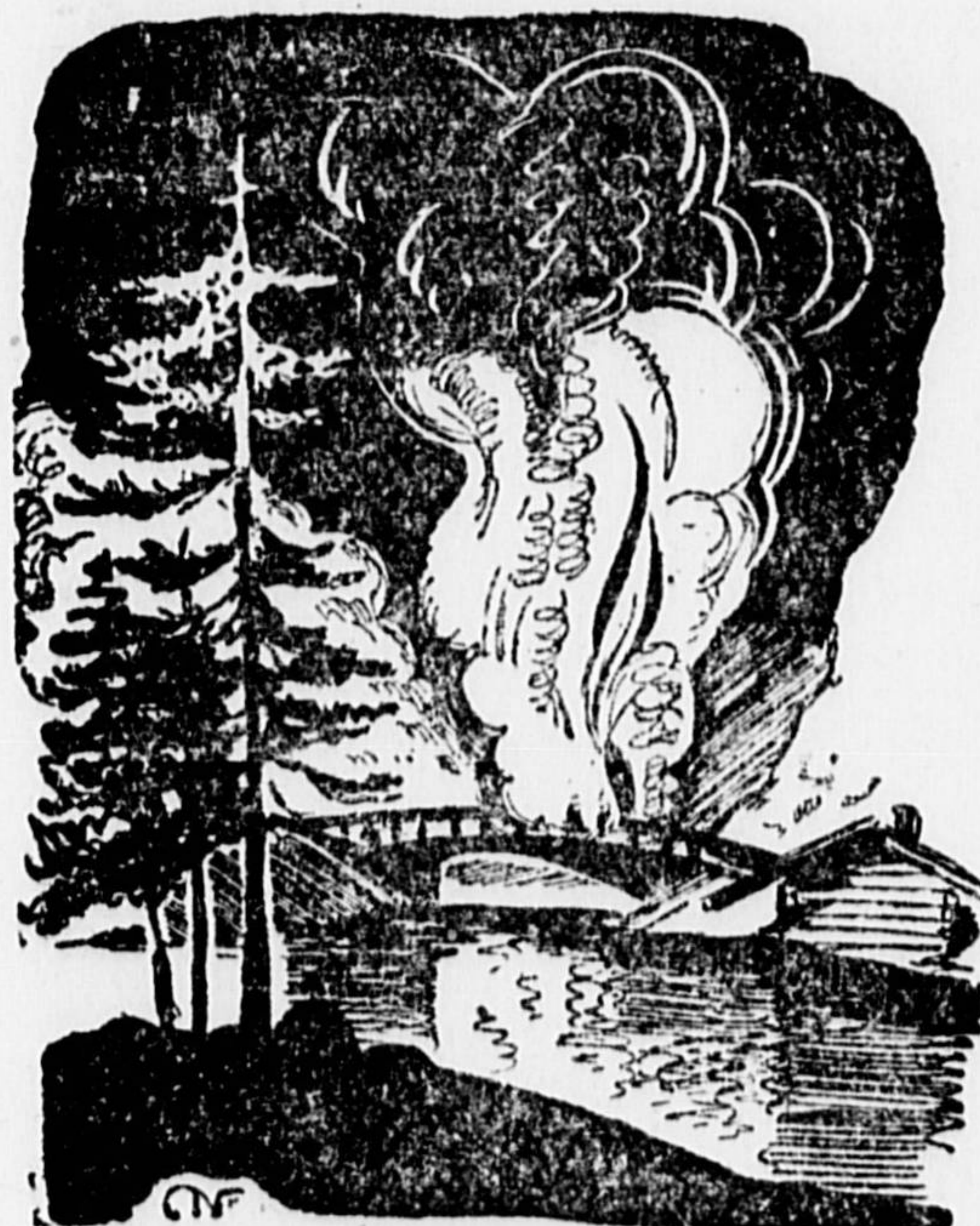
... Над мостом встал столб дыма.

Командир, поднявшись с земли, протянул комиссару руку.