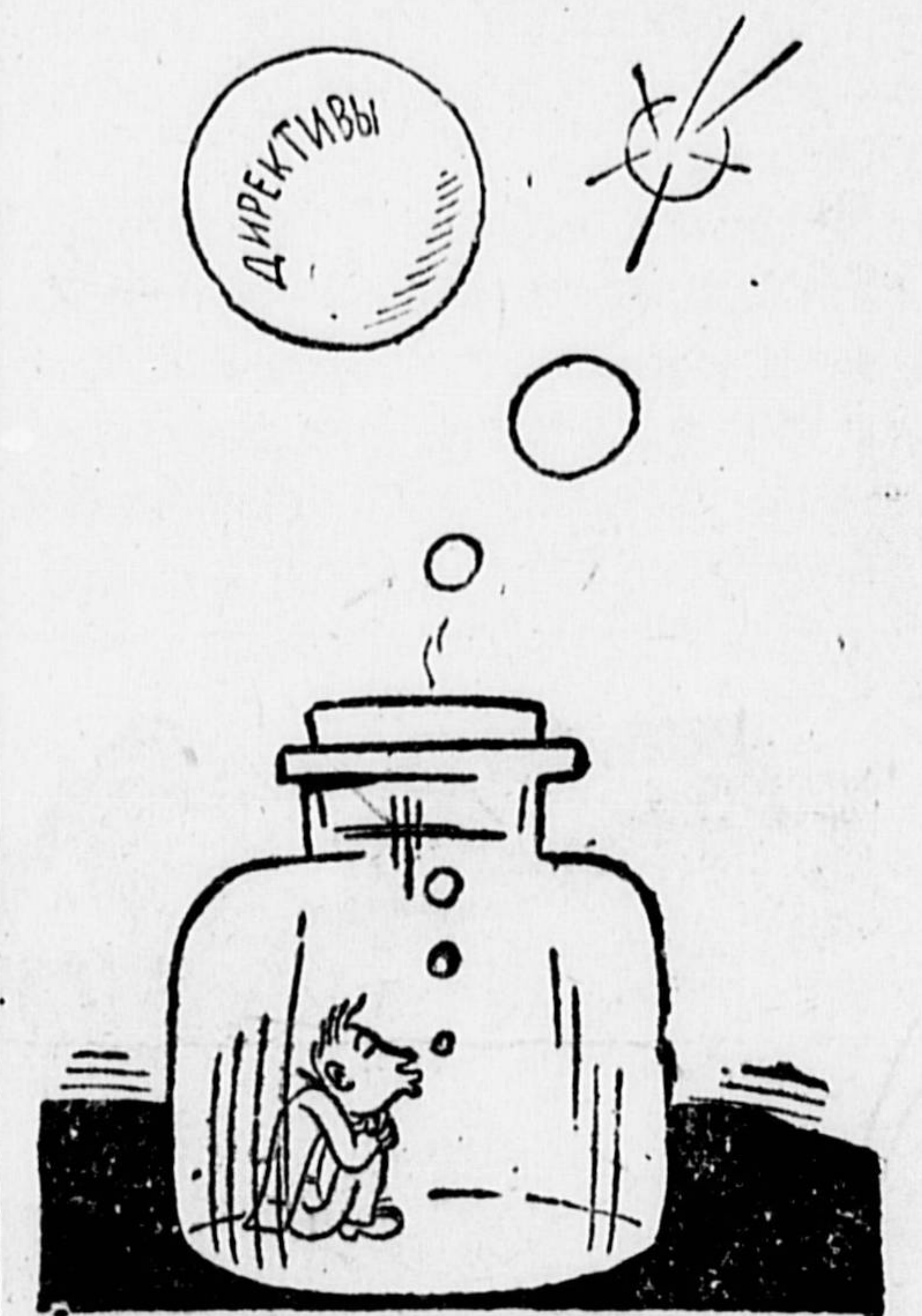
Райбюро подает признаки жизни.

В течение последних 6-ти месяцев Сосновское райбюро ДКО (ЦЧО) совершенно бездействует. Его работники сидят в комнате райбюро и строчат директиву за директивой. На места они не вы-