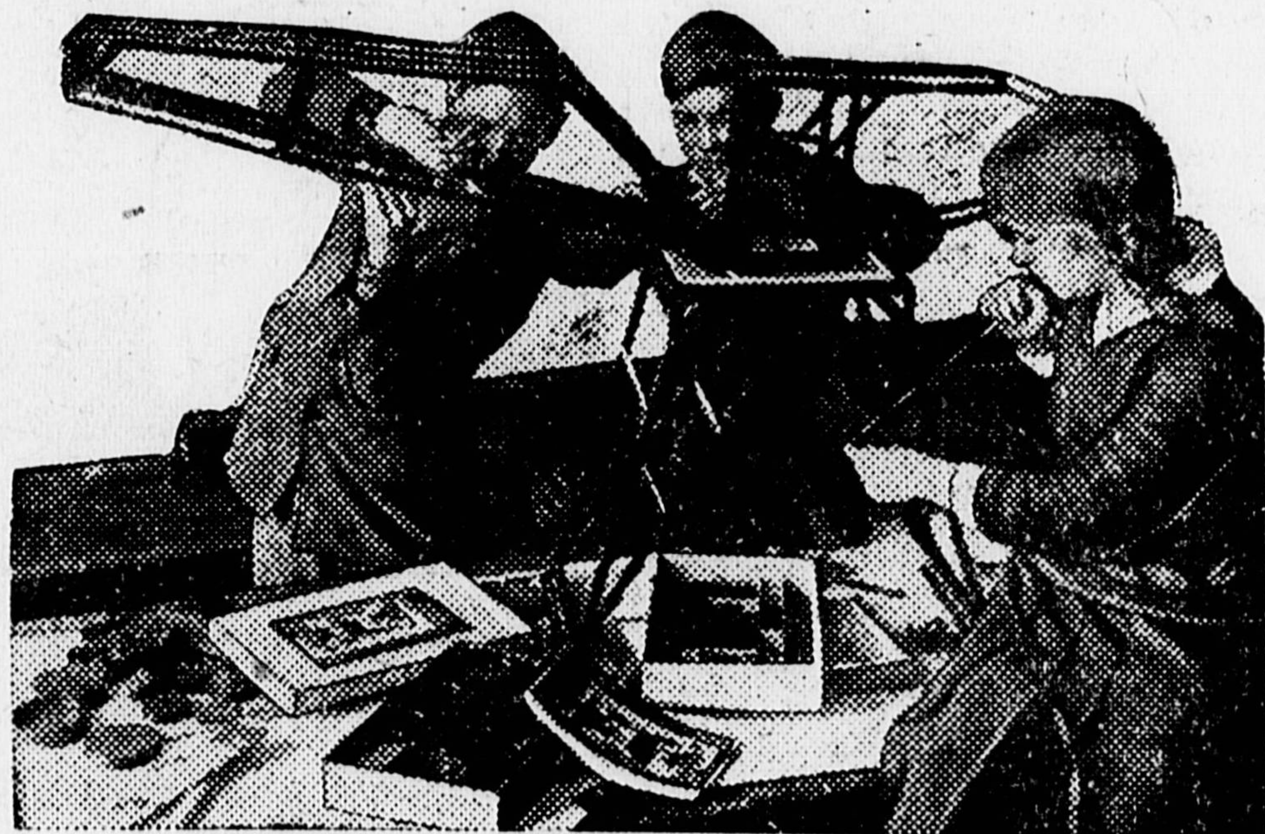
В 7-й школе Краснопресненского района создан кружок юных мекканистов.

Кружок надо разделить на бригады по 2 — 3 человека. Во главе каждой бригады надо поста-